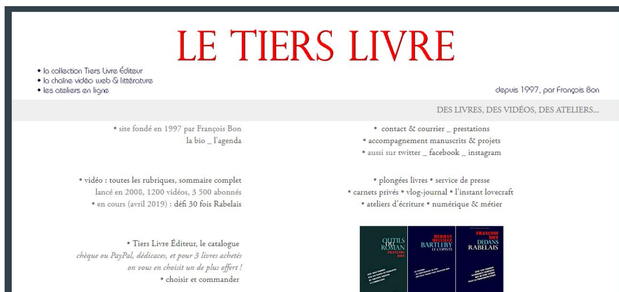
Figure 1. Page d'accueil du Tiers Livre, avril 2019